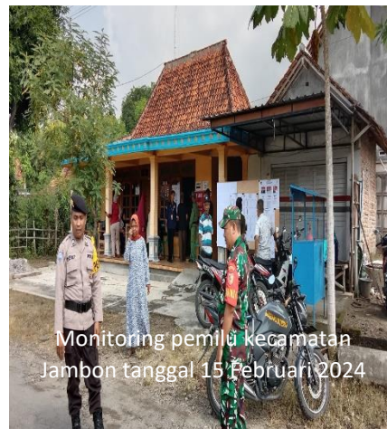
Monitoring pemilu kecamatan Jambon tanggal 15 Februari 2024