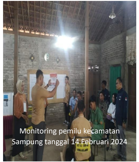
Monitoring pemilu kecamatan Sampung tanggal 14 Februari 2024