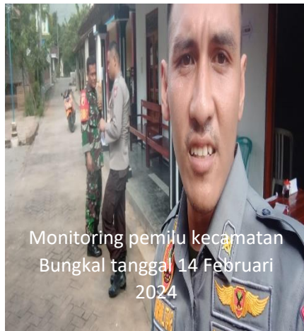
Monitoring pemilu kecamatan Bungkal tanggal 14 Februari 2024