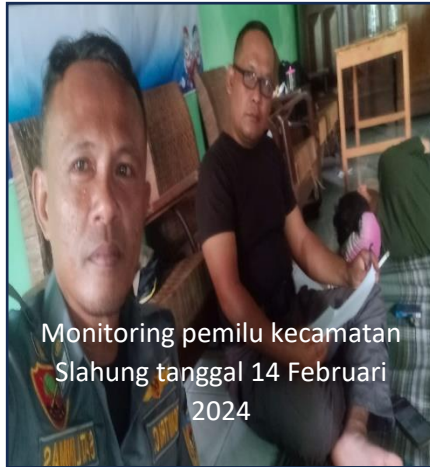
Monitoring pemilu kecamatan Slahung tanggal 14 Februari 2024