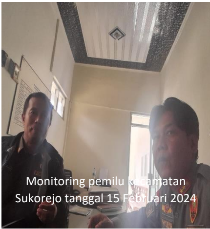
Monitoring pemilu kecamatan Sukorejo tanggal 15 Februari 2024