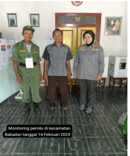
Monitoring pemilu di kecamatan Babadan tanggal 14 Februari 2024