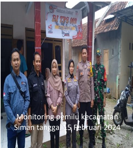
Monitoring pemilu kecamatan Siman tanggal 15 Februari 2024