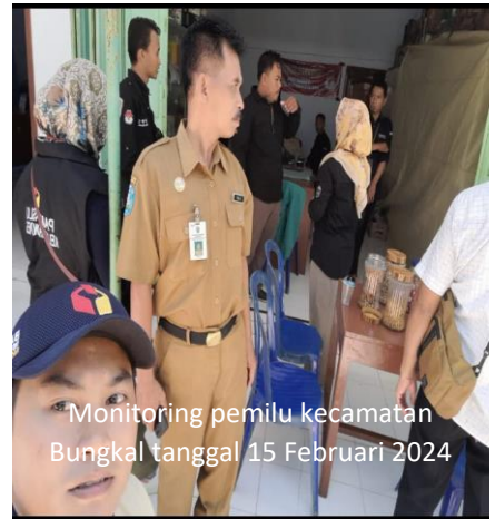
Monitoring pemilu kecamatan Bungkal tanggal 15 Februari 2024