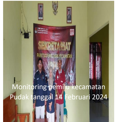
Monitoring pemilu kecamatan Pudak tanggal 14 Februari 2024