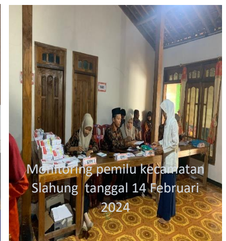
Monitoring pemilu kecamatan Slahung tanggal 14 Februari 2024