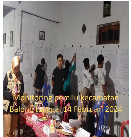
Monitoring pemilu kecamatan Balong tanggal 14 Februari 2024