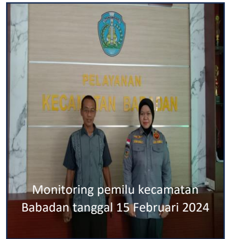
Monitoring pemilu kecamatan Babadan tanggal 15 Februari 2024