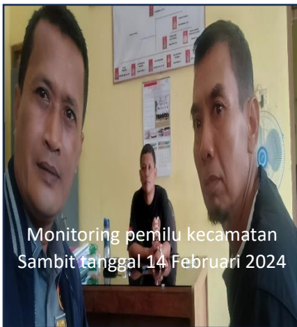
Monitoring pemilu kecamatan Sambit tanggal 14 Februari 2024