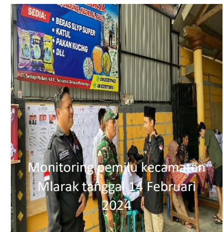
Monitoring pemilu kecamatan Mlarak tanggal 14 Februari 2024