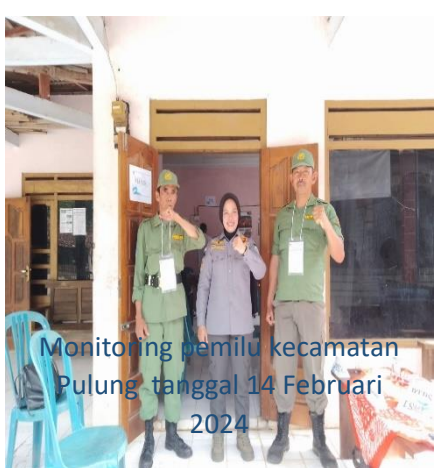
Monitoring pemilu kecamatan Pulung tanggal 14 Februari 2024