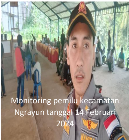
Monitoring pemilu kecamatan Ngrayun tanggal 14 Februari 2024