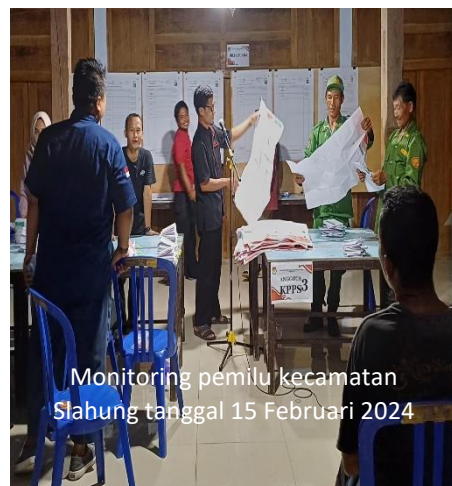
Monitoring pemilu kecamatan Slahung tanggal 15 Februari 2024