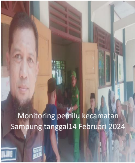
Monitoring pemilu kecamatan Sampung tanggal 14 Februari 2024