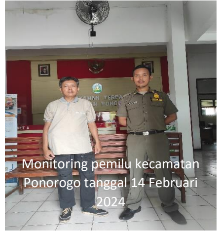
Monitoring pemilu kecamatan Ponorogo tanggal 14 Februari 2024