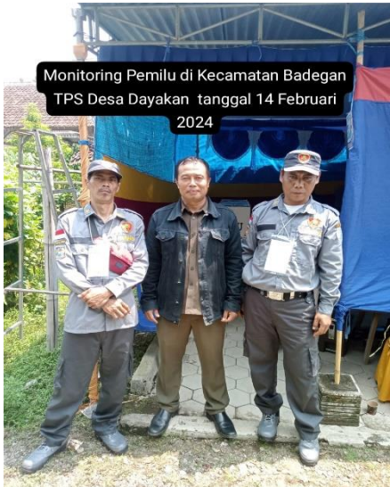
Monitoring Pemilu di Kecamatan Badegan TPS Desa Dayakan tanggal 14 Februari 2024