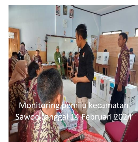
Monitoring pemilu kecamatan Sawoo tanggal 14 Februari 2024