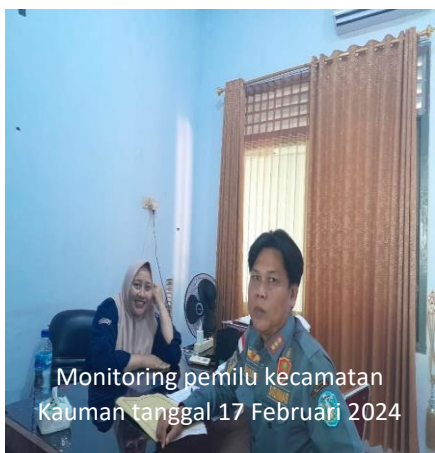
Monitoring pemilu kecamatan Kauman tanggal 17 Februari 2024