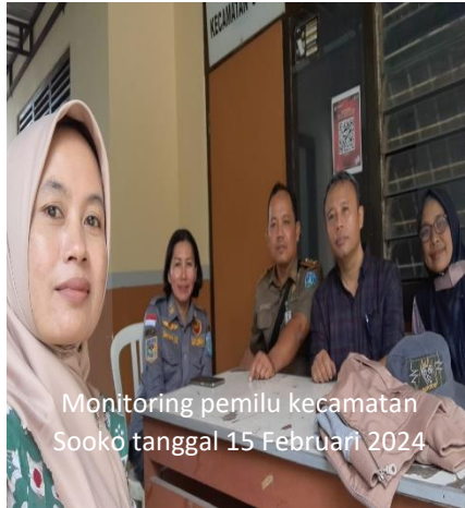
Monitoring pemilu kecamatan Sooko tanggal 15 Februari 2024