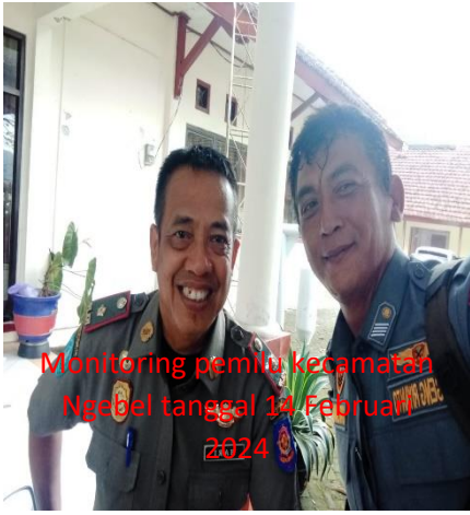
Monitoring pemilu kecamatan Ngebel tanggal 14 Februari 2024