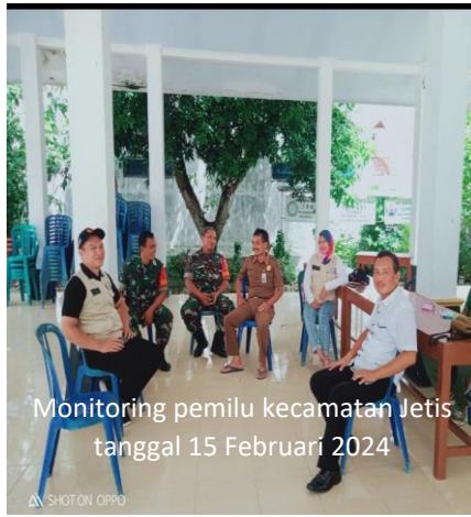
Monitoring pemilu kecamatan Jetis tanggal 15 Februari 2024