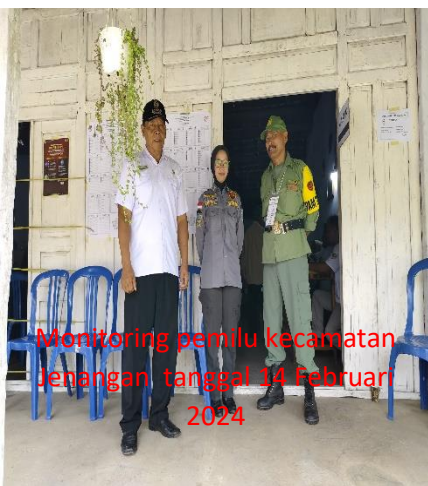
Monitoring pemilu kecamatan Jenangan tanggal 14 Februari 2024