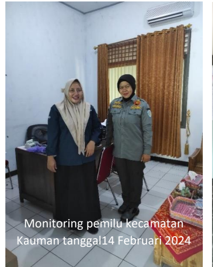
Monitoring pemilu kecamatan Kauman tanggal 14 Februari 2024