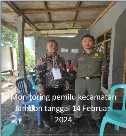
Monitoring pemilu kecamatan Jambon tanggal 14 Februari 2024