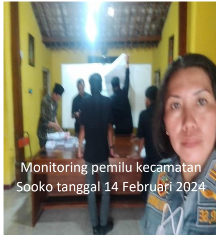
Monitoring pemilu kecamatan Sooko tanggal 14 Februari 2024