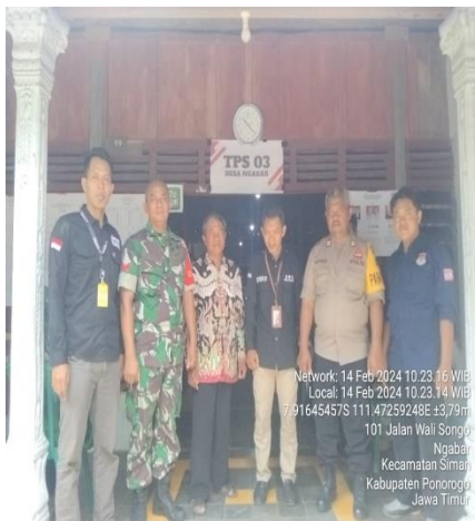
Network: 14 Feb 2024 10:23:16 WIB Local: 14 Feb 2024 10:23:14 WIB 7.916454575.111.47259248E+3.79m 101 Jalan Wali Songo Ngabati Kecamatan Simanunggalan Kabupaten Ponorogo Jawa Timur