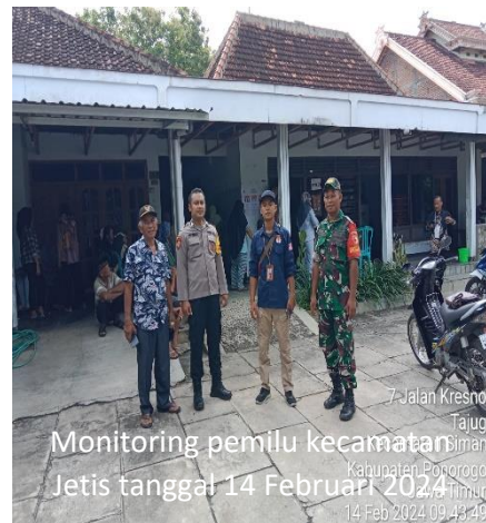
Monitoring pemilu kecamatan Jatis tanggal 14 Februari 2024