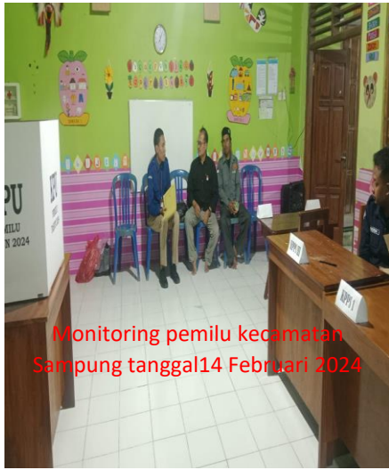
Monitoring pemilu kecamatan Sampung tanggal 14 Februari 2024