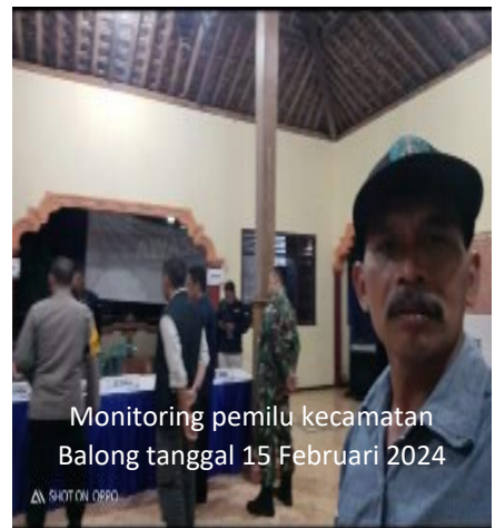
Monitoring pemilu kecamatan Balong tanggal 15 Februari 2024