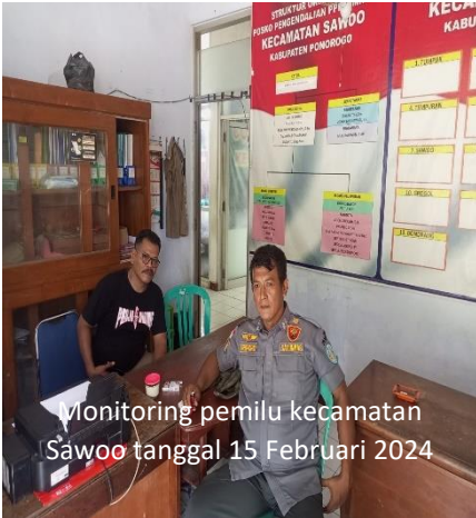
Monitoring pemilu kecamatan Sawoo tanggal 15 Februari 2024